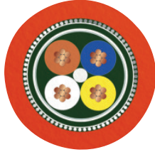
Sercos III [93K]