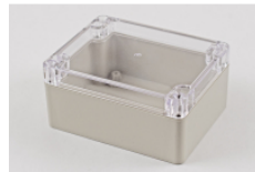
Beige ABS plastic with clear polycarbonate lid