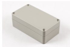
Beige ABS plastic