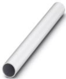
Tube, 250 mm long, Ø 25 mm

Please be informed that the data shown in this PDF Document is generated from our Online Catalog. Please find the complete data in the user's documentation. Our General Terms of Use for Downloads are valid ( http://phoenixcontact.com/download )