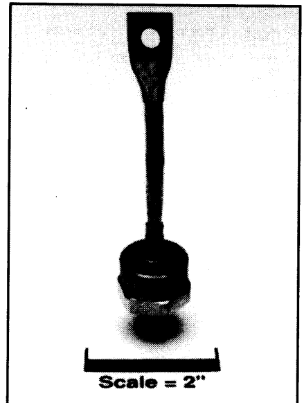
IN3288A, AR - IN3297A, AR General Purpose Rectifier 100 Amperes Average, 1400 Volts