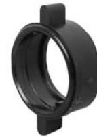
Winged Coupling Ring W/14482