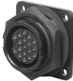
Panel Mount 14X8X-XXXG-XXX Matching Mates: • Cable Pin 13X8X-XXPG-XXX • Cable Socket 13X8X-XXSG-XXX