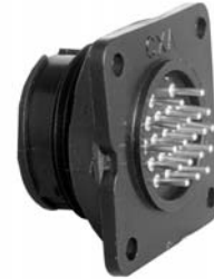
P/C Tail Panel Mount 14XXX-XXXG-XXX Matching Mates: • Cable Pin 13X8X-XXPG-XXX • Cable Socket 13X8X-XXSG-XXX