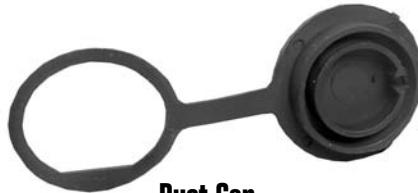
Dust Cap 14295