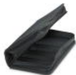
Tool box, empty

Tool bag - TOOL-KIT STANDARD EMPTY - 1212423