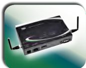
Digi Connect® WAN 3G