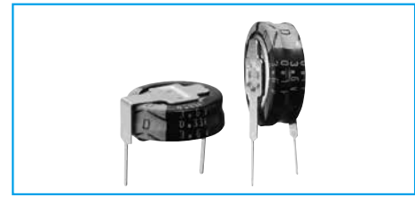
Marking color : White print on a black sleeve