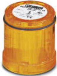
LED flashing beacon element, 24 V DC, double flash, yellow

Please be informed that the data shown in this PDF Document is generated from our Online Catalog. Please find the complete data in the user's documentation. Our General Terms of Use for Downloads are valid ( http://phoenixcontact.com/download )