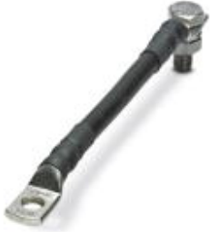
Connecting cable for FLT-ISG-100-EX, length 100 mm.

Please be informed that the data shown in this PDF Document is generated from our Online Catalog. Please find the complete data in the user's documentation. Our General Terms of Use for Downloads are valid ( http://phoenixcontact.com/download )