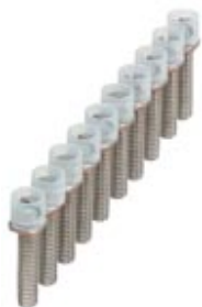
Bridge bar isolator, Number of positions: 10, Color: silver

Please be informed that the data shown in this PDF Document is generated from our Online Catalog. Please find the complete data in the user's documentation. Our General Terms of Use for Downloads are valid ( http://download.phoenixcontact.com )