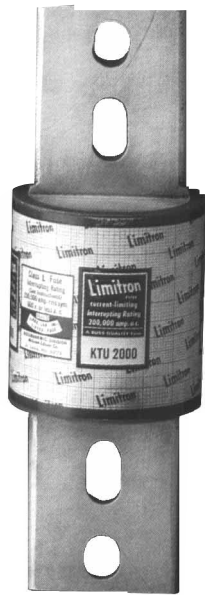
Dimensional Data *All other tolerances (±0.02)