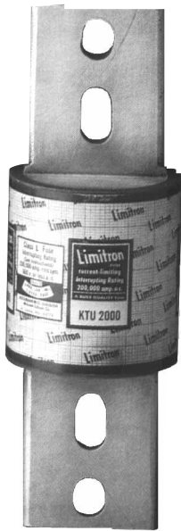
Dimensional Data *All other tolerances (±0.02)