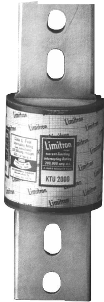
Dimensional Data *All other tolerances (±0.02)