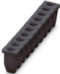
Insulating sleeve, Color: black

Please be informed that the data shown in this PDF Document is generated from our Online Catalog. Please find the complete data in the user's documentation. Our General Terms of Use for Downloads are valid ( http://phoenixcontact.com/download )