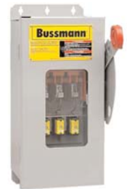
CF_ Quik-Spec™ Safety Switch disconnect (optional window). Data Sheet 1156

The only controlled copy of this Data Sheet is the electronic read-only version located on the Cooper Bussmann Network Drive. All other copies of this document are by definition uncontrolled. This bulletin is intended to clearly present comprehensive product data and provide technical information that will help the end user with design applications. Cooper Bussmann reserves the right, without notice, to change design or construction of any products and to discontinue or limit distribution of any products. Cooper Bussmann also reserves the right to change or update, without notice, any technical information contained in this bulletin. Once a product has been selected, it should be tested by the user in all possible applications.