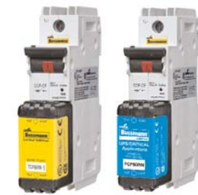
CCP_CF 1-, 2- & 3-Pole switched disconnects Data Sheet 1157