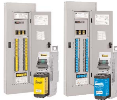
CCPB 1-, 2- & 3-Pole disconnects for the Quik-Spec™ Coordination Panelboard. Data Sheet 1160