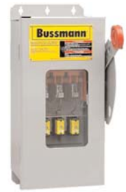
CF_ Quik-Spec™ Safety Switch disconnect (optional window). Data Sheet 1156

The only controlled copy of this Data Sheet is the electronic read-only version located on the Cooper Bussmann Network Drive. All other copies of this document are by definition uncontrolled. This bulletin is intended to clearly present comprehensive product data and provide technical information that will help the end user with design applications. Cooper Bussmann reserves the right, without notice, to change design or construction of any products and to discontinue or limit distribution of any products. Cooper Bussmann also reserves the right to change or update, without notice, any technical information contained in this bulletin. Once a product has been selected, it should be tested by the user in all possible applications.