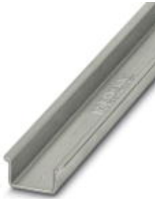
DIN rail, material: Steel, unperforated, 2.3 mm thick, height 15 mm, width 35 mm, length: 2 m

Please be informed that the data shown in this PDF Document is generated from our Online Catalog. Please find the complete data in the user's documentation. Our General Terms of Use for Downloads are valid ( http://download.phoenixcontact.com )