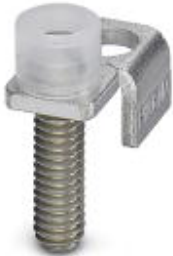
Chain bridge, Number of positions: 1, Color: silver

Please be informed that the data shown in this PDF Document is generated from our Online Catalog. Please find the complete data in the user's documentation. Our General Terms of Use for Downloads are valid ( http://phoenixcontact.com/download )