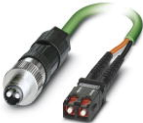
PCF-GI cable, assembled with M12 connector to SC-RJ

Please be informed that the data shown in this PDF Document is generated from our Online Catalog. Please find the complete data in the user's documentation. Our General Terms of Use for Downloads are valid ( http://phoenixcontact.com/download )