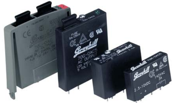
70L-OAC 70G-OAC 70-OAC 70M-OAC