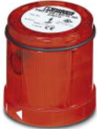
LED flashing beacon element, 24 V DC, double flash, red

Please be informed that the data shown in this PDF Document is generated from our Online Catalog. Please find the complete data in the user's documentation. Our General Terms of Use for Downloads are valid ( http://phoenixcontact.com/download )