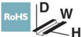
The figure shows EMG 17-REL/KSR-G 24/2E/SO38

Relay module, with soldered-in miniature switching relay, contact (AgNi): Medium to large loads, double A2 connection, 1 PDT, 230 V AC/DC input voltage