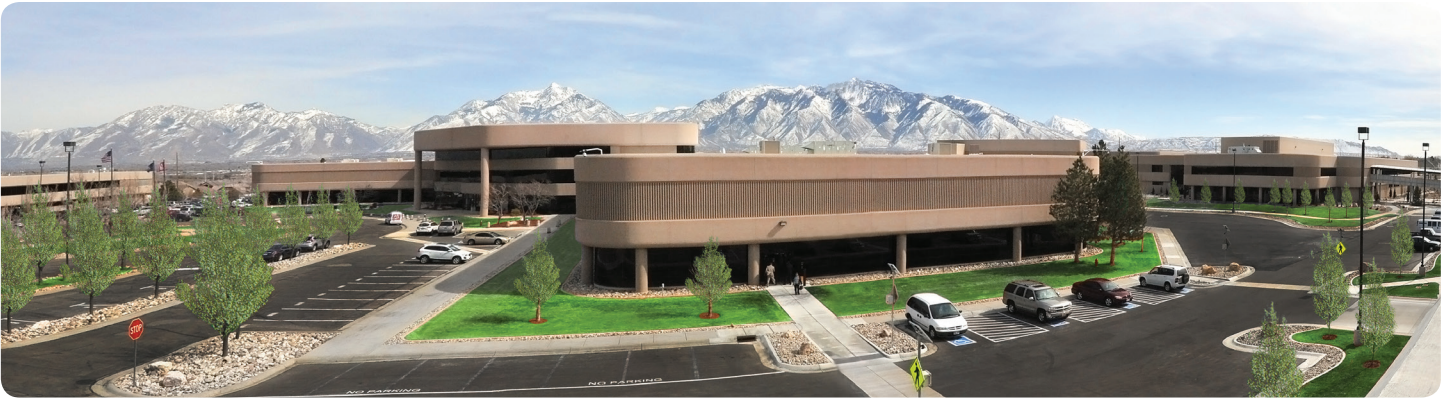
Merit Sensor is based in Salt Lake City, Utah