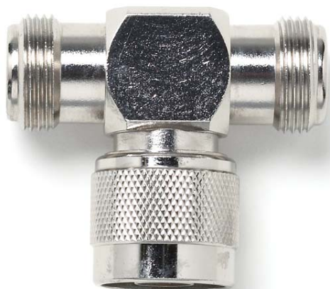
Model 73044 N Type "T" Jack-Plug-Jack Adapter