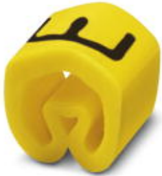
Conductor marking collar, labeled with the capital letter: Letters, yellow, width: 3.2 mm

Please be informed that the data shown in this PDF Document is generated from our Online Catalog. Please find the complete data in the user's documentation. Our General Terms of Use for Downloads are valid ( http://phoenixcontact.com/download )