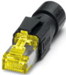
RJ45 connector, IP20, CAT6, 8-pos., with QUICKON fast connection technology, for 26 ... 24 AWG 1-wire and 7-wire conductors, color: black

Please be informed that the data shown in this PDF Document is generated from our Online Catalog. Please find the complete data in the user's documentation. Our General Terms of Use for Downloads are valid ( http://download.phoenixcontact.com )