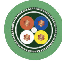
Cable cross section

Housing cutout for Pg9 fastening thread, mounting panel with feed-through hole (alternatively with surface as protection against rotation)