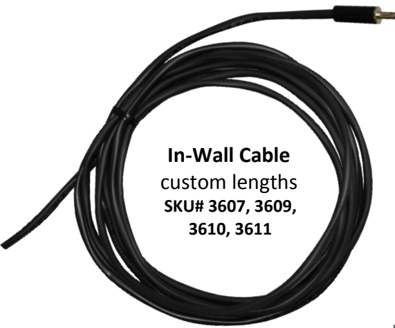
In-Wall Cable custom lengths SKU# 3607, 3609, 3610, 3611

Inspired LED's unique line of Interconnect Accessories are compatible with 3.5mm x 1.3mm DC input/output jacks. Cables are available in standard or custom lengths, and all interconnect products combine easily with Inspired LED flex strips and LED panels to create the perfect low-voltage lighting system for any location.