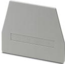
End cover, Length: 61 mm, Width: 2.2 mm, Color: gray

Please be informed that the data shown in this PDF Document is generated from our Online Catalog. Please find the complete data in the user's documentation. Our General Terms of Use for Downloads are valid ( http://download.phoenixcontact.com )