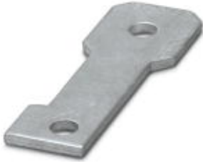
Plate for fixing the FLT-ISG-100-EX isolating spark gap to a flange, drill hole diameter of 11 mm.

Please be informed that the data shown in this PDF Document is generated from our Online Catalog. Please find the complete data in the user's documentation. Our General Terms of Use for Downloads are valid ( http://phoenixcontact.com/download )