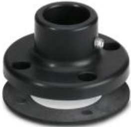
Foot for tube Ø 25 mm, metal, black

Please be informed that the data shown in this PDF Document is generated from our Online Catalog. Please find the complete data in the user's documentation. Our General Terms of Use for Downloads are valid ( http://phoenixcontact.com/download )