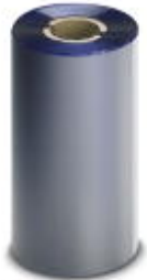
Ink ribbon, Length: 300000 mm, Width: 110 mm, Color: blue

Please be informed that the data shown in this PDF Document is generated from our Online Catalog. Please find the complete data in the user's documentation. Our General Terms of Use for Downloads are valid ( http://download.phoenixcontact.com )