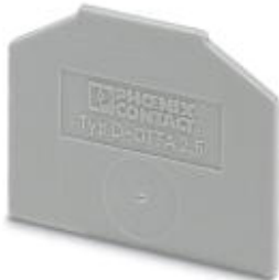
End cover, Length: 43.5 mm, Width: 1.5 mm, Color: gray

Please be informed that the data shown in this PDF Document is generated from our Online Catalog. Please find the complete data in the user's documentation. Our General Terms of Use for Downloads are valid ( http://download.phoenixcontact.com )