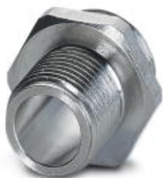
Housing screw connection, PlugLink:M12, Front mounting, M14 x 1

Please be informed that the data shown in this PDF Document is generated from our Online Catalog. Please find the complete data in the user's documentation. Our General Terms of Use for Downloads are valid ( http://phoenixcontact.com/download )