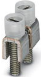
Fixed bridge, Number of positions: 2, Color: silver

Please be informed that the data shown in this PDF Document is generated from our Online Catalog. Please find the complete data in the user's documentation. Our General Terms of Use for Downloads are valid ( http://download.phoenixcontact.com )