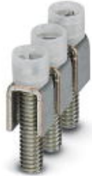
Fixed bridge, Number of positions: 3, Color: silver

Please be informed that the data shown in this PDF Document is generated from our Online Catalog. Please find the complete data in the user's documentation. Our General Terms of Use for Downloads are valid ( http://download.phoenixcontact.com )