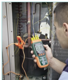
Simultaneously measures 4 temperature inputs for multiple source monitoring