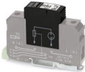
Surge protection plug type 2, with N-PE total current spark gap for base element.

Please be informed that the data shown in this PDF Document is generated from our Online Catalog. Please find the complete data in the user's documentation. Our General Terms of Use for Downloads are valid ( http://download.phoenixcontact.com )