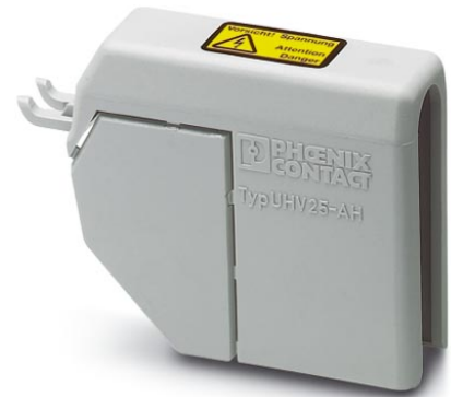
Illustration shows the product version UHV 25-AH

http://eshop.phoenixcontact.de/phoenix/treeViewClick.do?UID=2130460