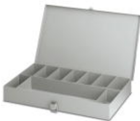
Assortment box, metal, no components mounted

Please be informed that the data shown in this PDF Document is generated from our Online Catalog. Please find the complete data in the user's documentation. Our General Terms of Use for Downloads are valid ( http://download.phoenixcontact.com )