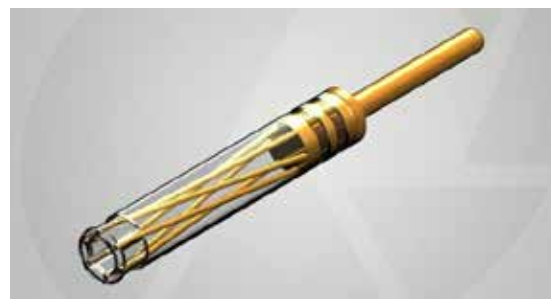
Micro-Hyperboloid Socket Contact