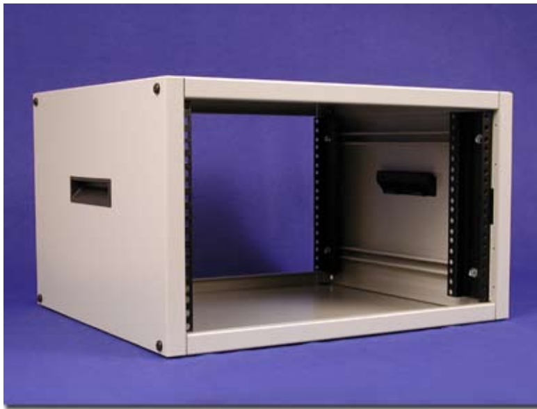
Light Gray (Textured)