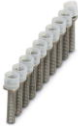
Bridge bar isolator, Number of positions: 10, Color: silver

Please be informed that the data shown in this PDF Document is generated from our Online Catalog. Please find the complete data in the user's documentation. Our General Terms of Use for Downloads are valid ( http://download.phoenixcontact.com )