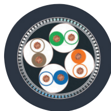
Cable cross section