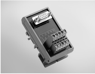
ADAM-3909 DB9 DIN-rail Wiring Board