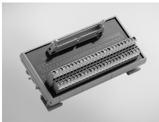
ADAM-3950 50-pin DIN-rail Flat Cable Wiring Board

PCI-1713U, PCI-1715U, PCI-1718HDU, PCI-1720U, PCI-1730U, PCI-1733, PCI-1734, PCI-1750, PCI-1760U, PCI-1761