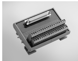
ADAM-3937 DB37 DIN-rail Wiring Board