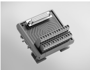
ADAM-3925 DB25 DIN-rail Wiring Board

PCI-1735U, PCL-711B, PCL-720+, PCL-726, PCL-727, PCL-730, PCL-812PG, PCL-816, PCL-818 Series, PCL-836