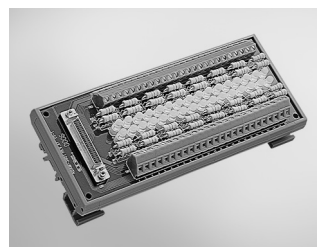
ADAM-3951 50-pin DIN-rail Wiring Board w/ LED Indicators

USB-4751/L, PCI-1737U, PCI-1739U, PCL-722, PCL-724, PCL-731