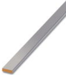
PEN conductor busbar, 3x10 mm, length: 2000 mm

Please be informed that the data shown in this PDF Document is generated from our Online Catalog. Please find the complete data in the user's documentation. Our General Terms of Use for Downloads are valid ( http://download.phoenixcontact.com )