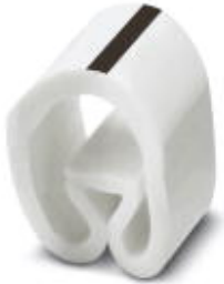
Conductor marking collar, labeled with the symbol: Symbols, white, width: 3.2 mm

Please be informed that the data shown in this PDF Document is generated from our Online Catalog. Please find the complete data in the user's documentation. Our General Terms of Use for Downloads are valid ( http://phoenixcontact.com/download )