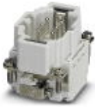
HEAVYCON male insert, B6 series, 6-pos., push-in connection

Contact insert - HC-B 6-I-DT-M - 1648131